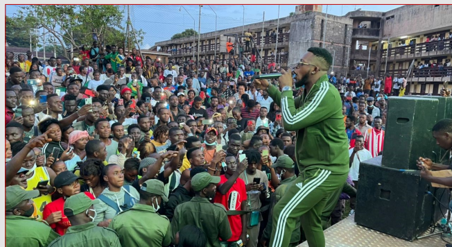
Université de Yaoundé 1, 29 avril 2022, Concert CHOCO MOOV Ténor

(PPSAC) de la tranche d'âge 15-24 ans. Une opportunité que l'ACMS saisi pour sensibiliser les jeunes sur le port systématique et correct du préservatif.