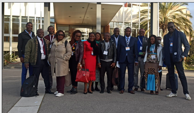
Une partie de la délégation camerounaise à AFRAVIH 2022

de défis à relever ; à l'issue de la conférence, l'ensemble des pays participants ont été appelés à fédérer les efforts pour contribuer à l'amélioration des thématiques suivantes : Le traitement adapté pour la prise en charge pédiatrique, l'implication des adolescents dans la prise de décision et la mise en œuvre, la transition des adolescents vers les services adultes, la communication numérique, les interventions communautaires et enfin la recherche des financements.