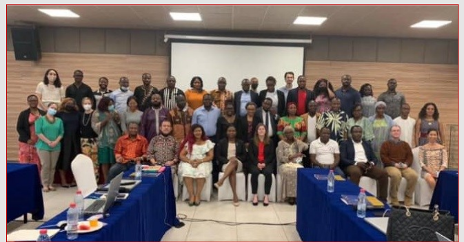
COP22 Cameroon, douala, family picture

dialogue in order to have a common and harmonized understanding with the country, the government, multilateral partners and civil society for the orientation of the COP 2022. Also, the best ways to preserve treatment gains have been identified, by improving retention and viral suppression of patients on treatment, as well as increasing case finding, if necessary, by improving treatment linkage and carrying out effective prevention activities. Finally, the activities, budget and objectives of the COP 2022 were finalized. The CNLS team presented the performance of the Global Fund NFM3 (New Funding Model 3) grant and the data on HIV-TB co-infection.