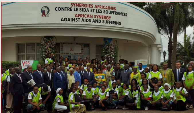
Photo de famille à la fin de la Coordination CTD—CCOUSP—27 juin 2023

En ciblant spécifiquement les adolescents et les jeunes de 15 à 24 ans, la campagne Vacances Sans Sida es-