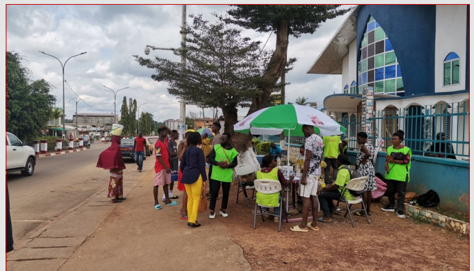
GTR-SUD : CONSEIL DÉPISTAGE VOLONTAIRE