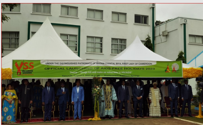
2 septembre 2023, esplanade Synergies Africaine, aperçu des autorités

Le 2 août 2023, à l'esplanade du siège de Synergies Africaines contre le sida et les souffrances, a eu lieu le lancement officiel de la 21e édition de la campagne nationale de sensibilisation Vacances sans sida. Cette campagne, placée sous le haut patronage de la Première Dame du Cameroun, Madame Chantal BIYA, avait pour thème « Les drogues tuent et nous exposent au VIH/sida ». Elle vise à contribuer à la lutte contre le VIH/sida chez les adolescents et les jeunes à travers le renforcement de la communication pour le changement de comportement et de l'offre de dépistage au VIH.