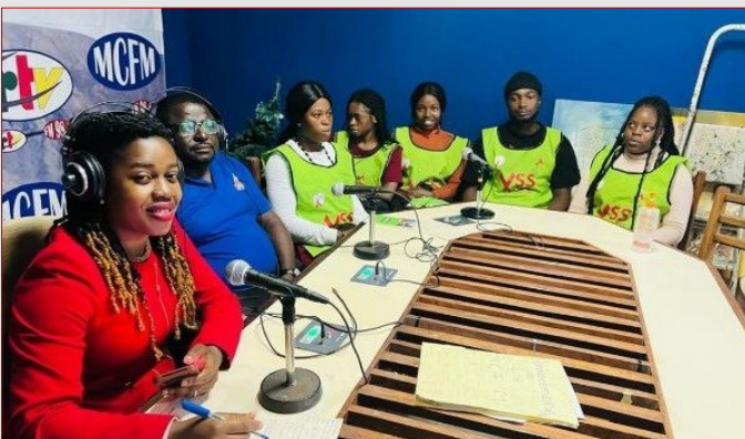
GTR-SUD OUEST : SENSIBILISATION DE MASSE À TRAVERS MONT CAMEROON FM / CRTV