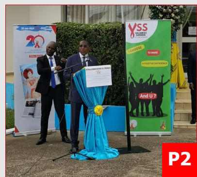
LANCEMENT DE LA CAMPAGNE VSS 2023

Madi Charles Crédit photo CNLS Montage Mbenti Yves Distribution GTC-SCOM