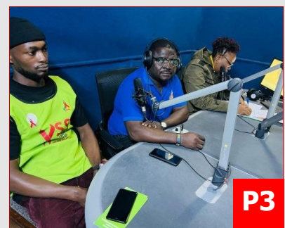
À TRAVERS L'OBJECTIF...