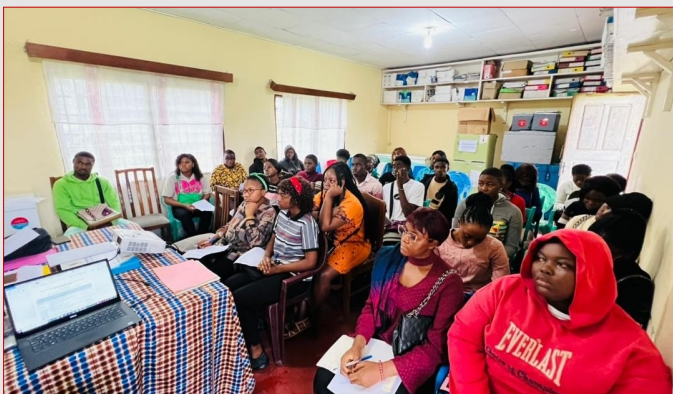
GTR SUD-OUEST : FORMATION DES PAIRS EDUCATEURS