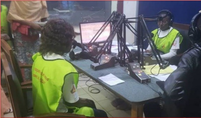
GTR-ADAMAOUA : LES PAIRS ÉDUCATEURS PARLENT DE DROGUES ET VIH À LA CRTV