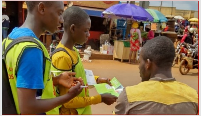
GTR-OUEST : DES PAIRS ÉDUCATEURS EXPLIQUENT LE CONTENU DU DÉPLIANT