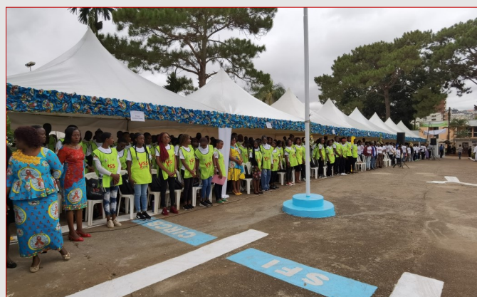
2 septembre 2023, esplanade Synergies Africaine, aperçu des pairs éducateurs