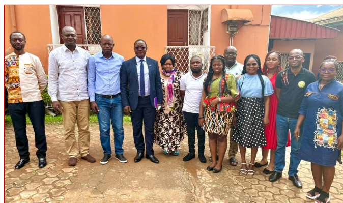
Ebolowa, 25 août 2023 : Photo de famille avec quelques participants

d'adaptation aux réalités locales. Les experts qui ont contribué à sa rédaction sont des professionnels chevronnés dans le domaine de la lutte contre les IST et le VIH/sida. Leur expérience et leurs connaissances approfondies ont été essentielles pour garantir la qualité et la pertinence des informations fournies tout en simplifiant leur compréhension pour un large public.