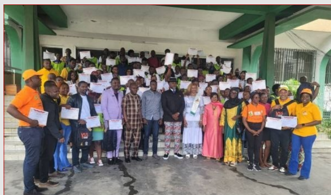
2 SEPTEMBRE 2023, SALLE DES BANQUETS DES SERVICES DU GOUVERNEUR DE LA RÉGION DU LITTORAL / REMISE DES CERTIFICATS DE PARTICIPATION—PHOTO DE FAMILLE