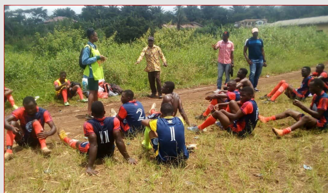
GTR LITTORAL—NKONGSAMBA : SENSIBILISATION PENDANT LES CHAMPIONNATS DE VACANCES