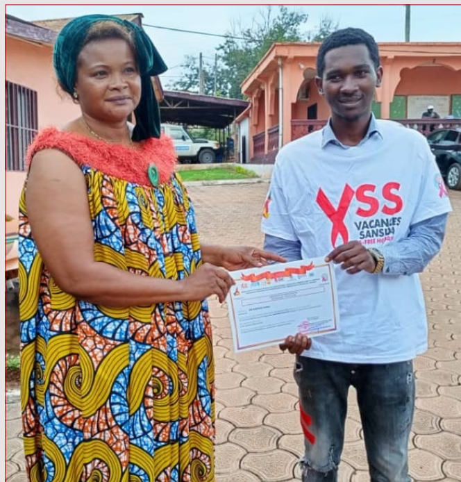
Clôture de la campagne VSS 2023, GTR EST, remise du certificat

s'agit d'eux ont inondé la toile avec des supports de communication spécialement conçus pour la campagne. Deuxièmement, l'opérateur de téléphonie mobile CAMTEL a au profit de VSS, véhiculé des messages de sensibilisation ciblés à travers les SMS, à 500